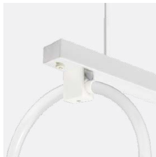
Fassungskaschierung in Leuchtenfarbe