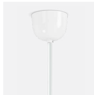
Baldachin in Halbkugelform Ø 100 mm mit Pendelrohr Ø 10 mm